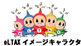
eLTAX イメージキャラクター

e-Tax ホームページ ( http://www.e-tax.nta.go.jp/ ) をご覧ください。