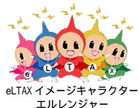
eLTAX イメージキャラクター エルレンジャー