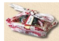
信玄餅の包み体験も