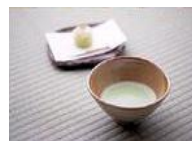
庭園でのお抹茶サービス