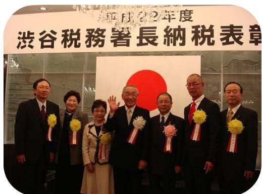
小島署長と川口会長と受彰者