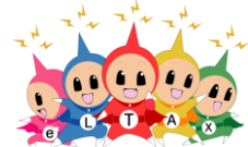
eLTAX イメージキャラクター エルレンジャー