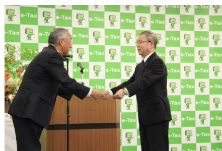
川口会長(右)と小島前署長(左)