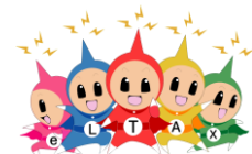
eLTAX イメージキャラクター エルレンジャー