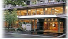
下部温泉下部ホテル

今年も恒例、秋の日帰りバス旅行の時期になりました。 御岳昇仙峡では、全国観光地百選 渓谷の部第一位に選ばれました素晴らしい渓谷美をぜひお楽しみ下さい。 昼食は、信玄の隠し湯として有名な下部温泉『下部ホテル』での会席膳とご入浴。またフルーツ王国山梨ぶどう狩りや、新酒も試飲できるモンデ酒造見学、お買物と盛り沢山のコースとなっております。 皆様のご参加をお待ちしております。