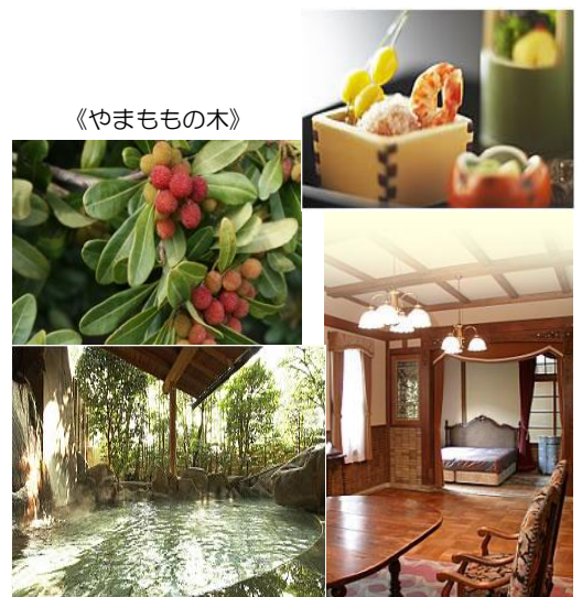
《坐漁荘・露天風呂》