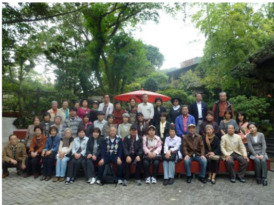
総勢43名様 ご参加 記念の集合写真