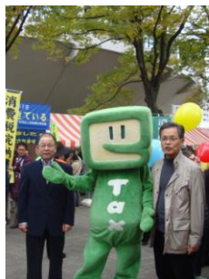
川口会長・イータ君と渋谷税務署三次署長