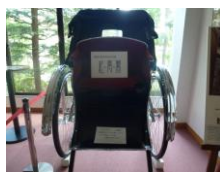
熱海市指定有形文化財