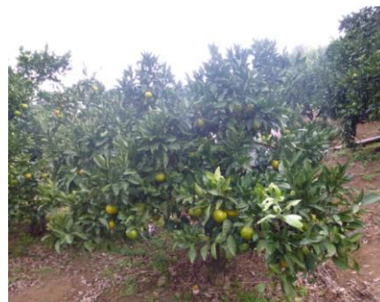
早生のみかん狩り