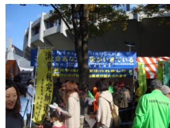
秋晴れの下、大勢の方がご来場