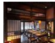
《和食懐石・季の音》