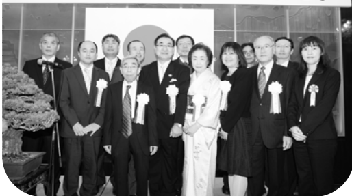
金森渋谷税務署長と受彰者のみなさん