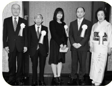
各受賞者のみなさん