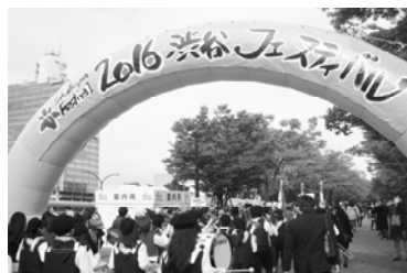
フェスティバルゲートと鼓笛隊