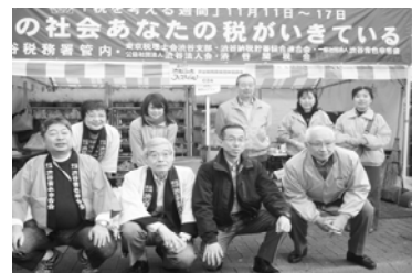
渋谷税務署長と渋谷納税団体のみなさん