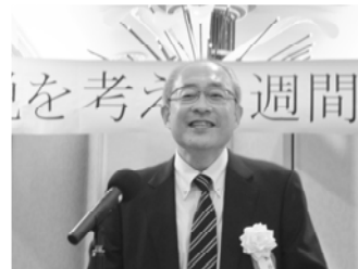
市川渋谷税務署副署長

また、講演会終了後は青色普及会勢拡大出陣式と意見交換会が行われ、会勢拡大や今後の会活動等について活発な意見交換を行い、大いに盛り上がりました。