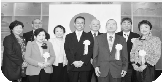
三塚渋谷税務署長と受彰者のみなさん