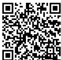
源泉所得税の納付手続

また、納付手続の「自動ダイレクト」（自動引落とし）は、e-Taxによる徴収高計算書（源泉所得税）の提出と同時に納付手続まで完了する便利な手続となっておりますので是非ご利用ください。