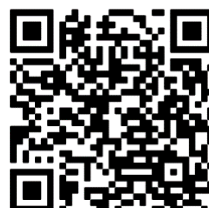
源泉所得税のキャッシュ レス納付 体験コーナー